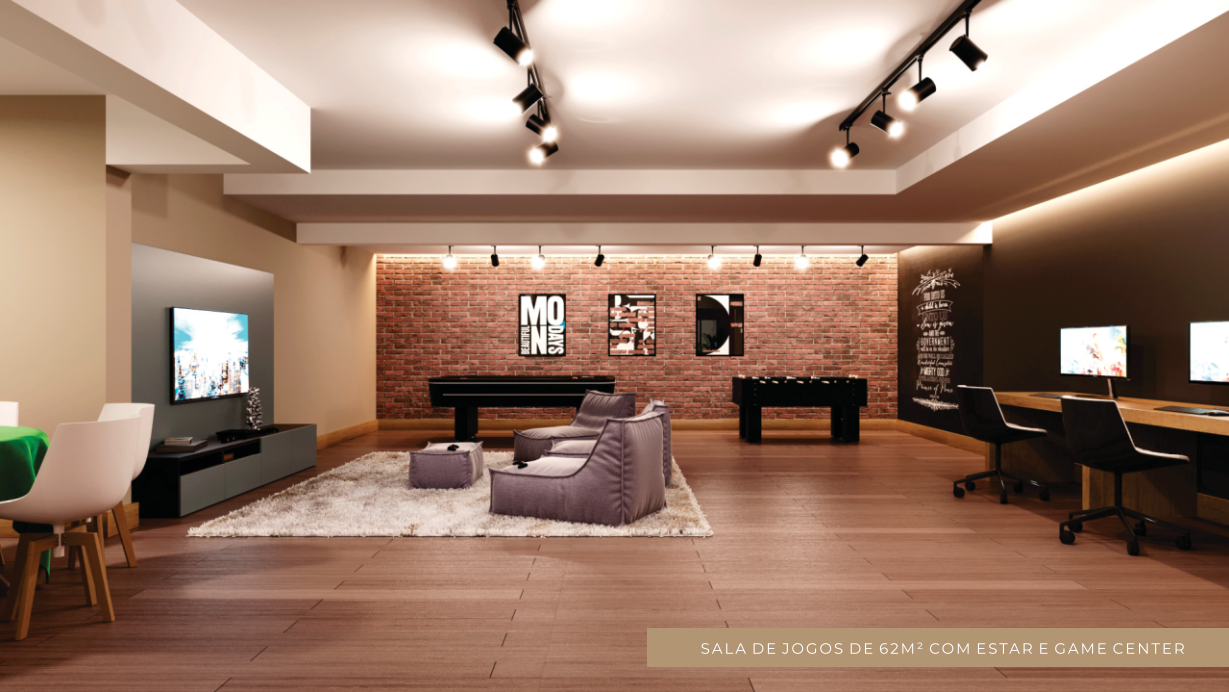
SALA DE JOGOS DE 62M 2 COM ESTAR E GAME CENTER