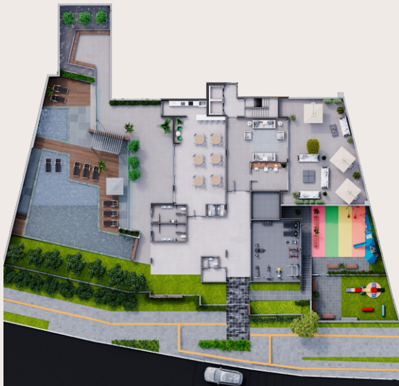
RUA EDMUNDO BASTIAN